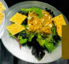
Tartar de salmón ahumado con aguacate 9.80 € Smoked salmon tartare with avocado