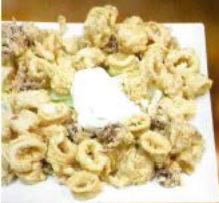
Calamares fritos 8,30 € - 8,50 € Fried squid rings