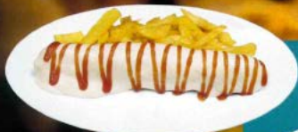
Crispín de merluza 8.60 C Breaded hake in bechamel sauce