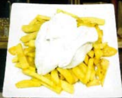
Patatas alioli frías 2,80 € - 5,30 € - 7,50 € Chips with garlic mayonnaise