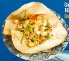
Crujiente de rosada 10,90 € Crunchy pink fish