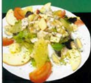
Ensalada caprichosa de pollo 8,90 € Fancy salad with chicken