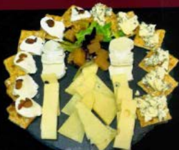
Tabla de quesos 13,20 € Cheese board