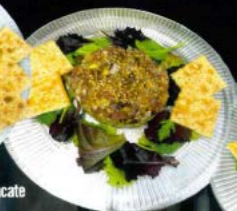
Tartar de atún rojo fresco con aguacate 9.80 € Fresh bluefin tuna tartare with avocado