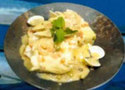
Merluza a la vasca 12,30 € Hake Basque style