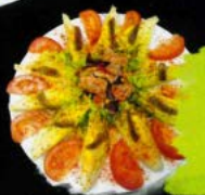
Cogollitos con anchoa del Cantábrico 9,60 € Lettuce buds with cantabrian anchovies