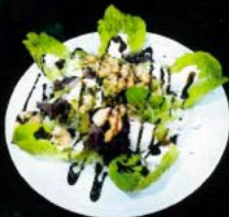
Ensalada templada de gambas 9,60 € Warm prawns salad