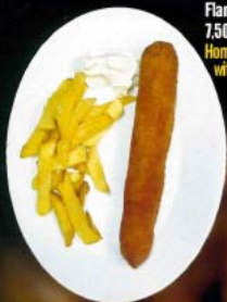
Flamenquín de lomo y jamón 7.50 C Homemade flamenquín with ham and loin