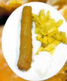
Flamenquín de pollo y jamón 7.50 C Homemade flamenquín with chicken and ham