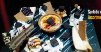
Surtido de postres Assortment of desserts