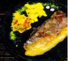
Entrecot de temera (380 gr.) "Novillada Premium" 17,00 € Beef steak