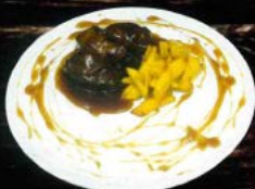
Carrillada estofada al PX 10,50 € Cheek stew at PX.