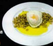
Habitas salteadas con jamón 8,20 € Sauteed baby beans with ham