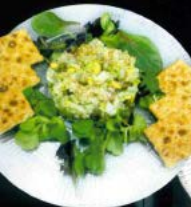
Tartar de bacalao ahumado con aguacate 9.80 € Smoked cod tartare with avocado