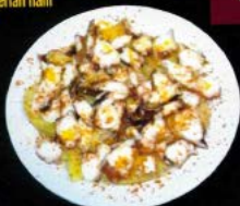
Pulpo a la gallega 16,80 € (240 gr.) Galician style octopus