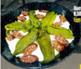
Huevos con pimientos y chorizo 8,50 € - 15,50 € Eggs with peppers and chorizo