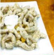
Cerdo de solomillo 8,00 € - 7,90 € Fried pork tenderloin