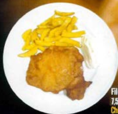
Filete empanado 7.50 C Chicken escalope