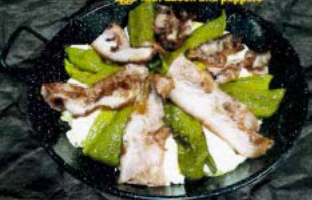
Huevos con bacon y pimientos 8,50 € - 15,50 € Eggs with bacon and peppers