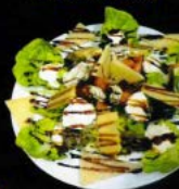
Ensalada de quesos con 9,70 € Cheese salad with honey