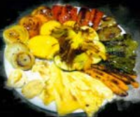
Parrillada de verduras con queso 12,90 € Grilled vegetables with cheese