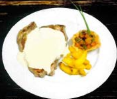
Solomillo al roquefort (180 gr. - 350 gr.) 8,50 € - 12,50 € Roquefort sirloin steak