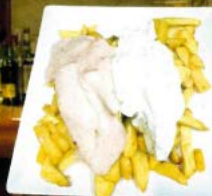
Patatas alibravas 2,80 € - 5,30 € - 7,50 € Spicy garlic mayonnaise chips