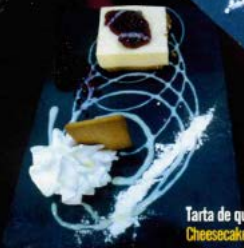
Tarta de queso Cheesecake