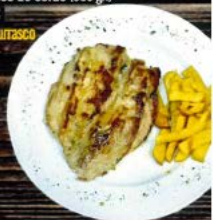
Churrasco de cerdo (350 gr.) 12,00 € Pork churrasco