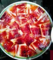
Jamón ibérico 10,00 € - 17,00 € (70 gr.-150 gr.) Iberian ham