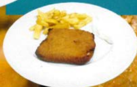
San Jacobo 7.50 C Ham and chips escalope