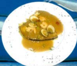
Pez espada al Montilla 12,00 € Swordfish Montilla wine style