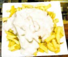
Patatas bravas 2,80 € - 5,30 € - 7,50 € Chips with spicy garlic mayonnaise