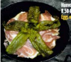
Huevos con pimientos y jamón 8,50 € - 15,50 € Eggs with peppers and ham