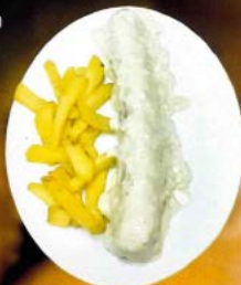
Flamenquín al roquefort 7.50 C Homemade flamenquín with roquefort