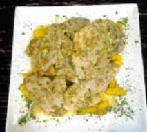
Puntas de solomillo al ajo perejil (300 gr.) 10,00 € Sirloin tips with garlic parsley