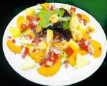
Ensalada tropical 8,50 € Tropical salad