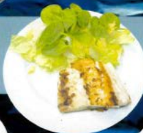
Suprema de Bacalao Plancha 12,30 € Grilled cod supreme