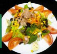
Ensalada mixta 6,80 € Mixed salad