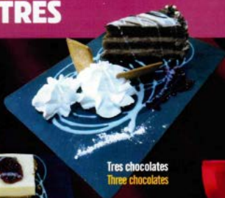
Tres chocolates Three chocolates