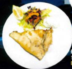
Pez espada a la plancha 12,00 € Grilled swordfish