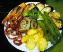
Parrillada de verduras 10,90 € Grilled vegetables