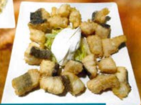
Bacalao frito 5,30 € - 8,00 € Battered cod chunks