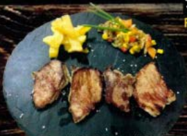
Presa ibérica de bellota (250 gr.) 15,00 € Iberian acorn ham