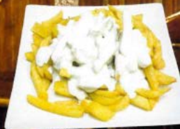
Patatas al roquefort 2,80 € - 5,30 € - 7,50 € Chips with roquefort cheese sauce