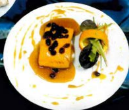
Salmón a la naranja 12,10 € Salmon orange