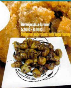
Berenjenas a la miel 5.90 C - 8.00 C Battered aubergines with sugar honey